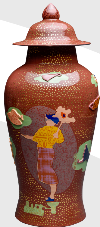
03 Charlotte Hodes. Conversations en plein air Vase, 2023 Engobes de couleur et transferts d'émail découpés à la main sur faïence