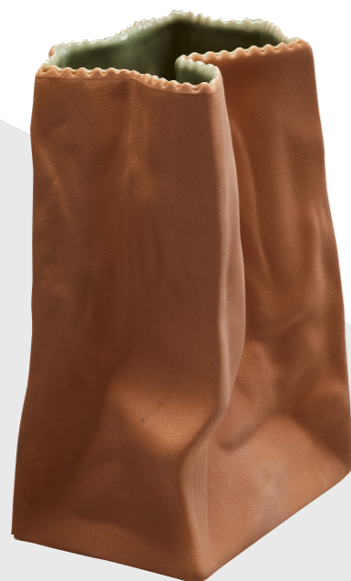
04 Tapio Wirkkala, manufacture Rosenthal, Vase, 1 er quart 21 e s. Porcelaine, émail brun et vert