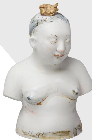
05 Gundi Dietz | Emily (buste), 2008 Porcelaine moulée, modelée, émaux et oxydes, or, 2008