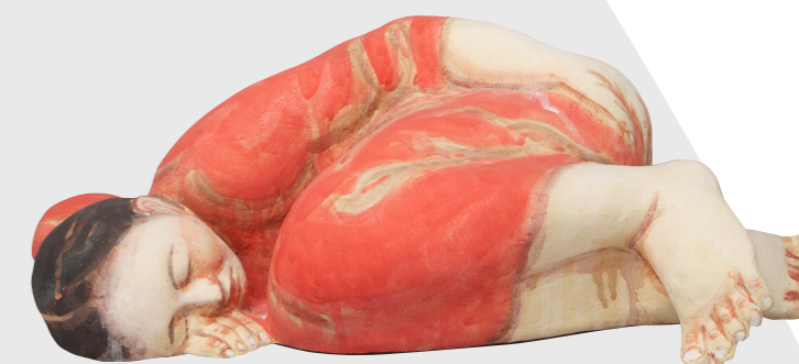
05 Akio Takamori | Sleeping woman in red dress, 2012 Grès modelé, engobes