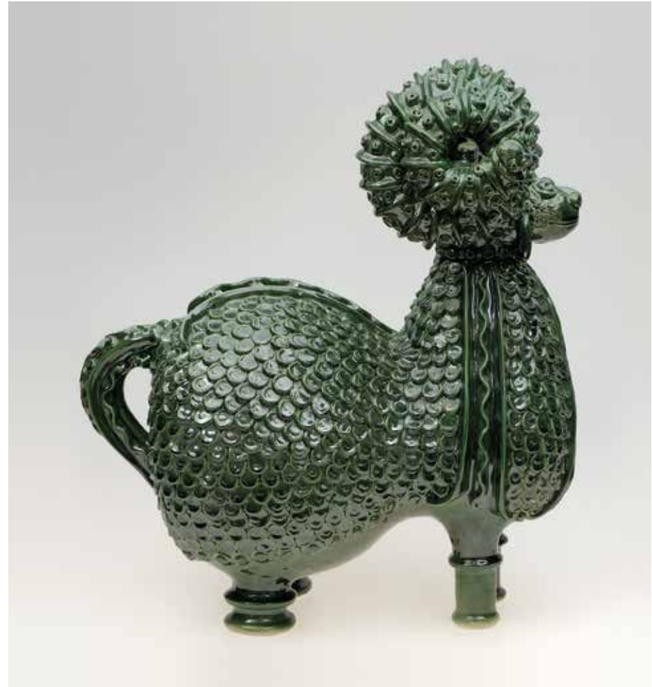
Don AIC ( Echange Culturel Mondial ), 1960 | Inv. AR 4238 IAC donation ( World Cultural Exchange ), 1960 | Inv. AR 4238

Terre cuite émaillée Glazed terracotta H. 47 cm | 1958